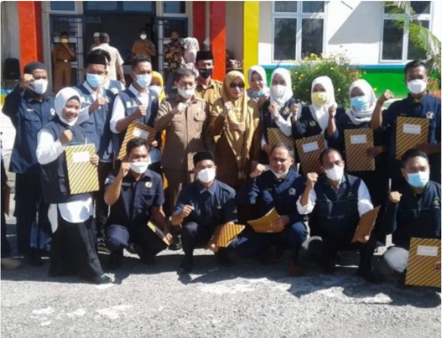
Gambar : Sekda Aceh Tenggara Poto Bersama 16 Anggota TKSK

Aceh Tenggara - Sekretariat Daerah (Sekda) Kabupaten Aceh Tenggara mengukuhkan dan sekaligus membagikan Surat Keputusan (SK) kepada 16 orang Tenaga Kesejahteraan Sosial Kecamatan (TKSK) se-Kabupaten Aceh Tenggara, di Depan Kantor Dinsos Aceh Tenggara. Selasa (12/04/2022).